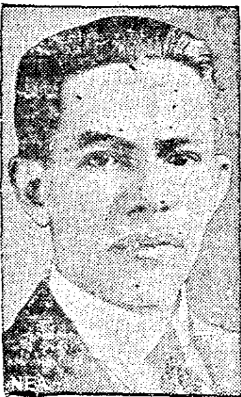
Presidente de la República En quien el Comercio tiene fundadas sus esperanzas para el resurgimiento del país.