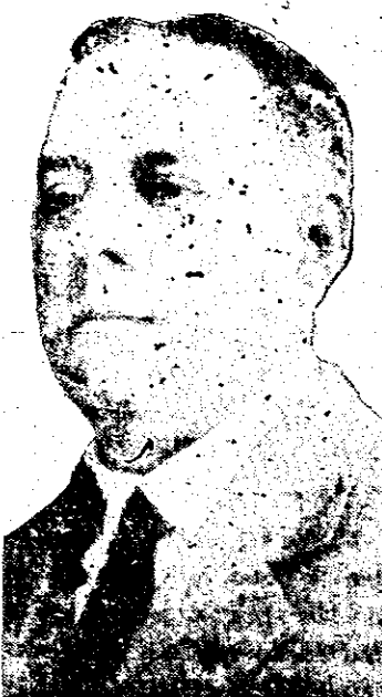
Gobernador de la Provincia de Panamá