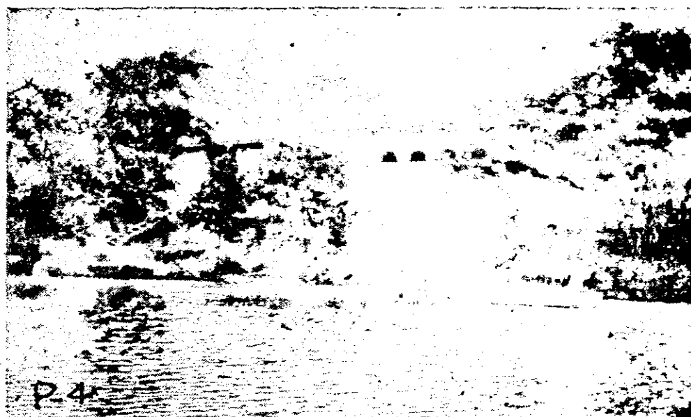
BAÑO DE LAS MENDOZAS

Baño de Las Mendozas—Penonomé, uno de los más preciosos en el interior de la República. En las márgenes del río se encuentran pintorescas fincas como la que presentamos en este fotograbado. Las linfas claras de este río, pueden ser un poderoso atractivo para el turismo.