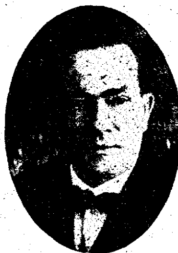
Secretario de Relaciones Exteriores

Quien está en la actualidad estudiando grandes problemas internacionales.