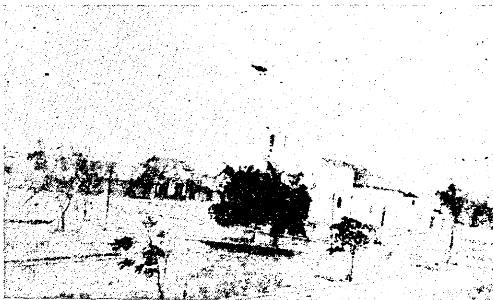
PLAZA DE ANTON

Nuestros lectores podrán apreciar en esta vista la simpática Plaza de la progresista población de Antón.